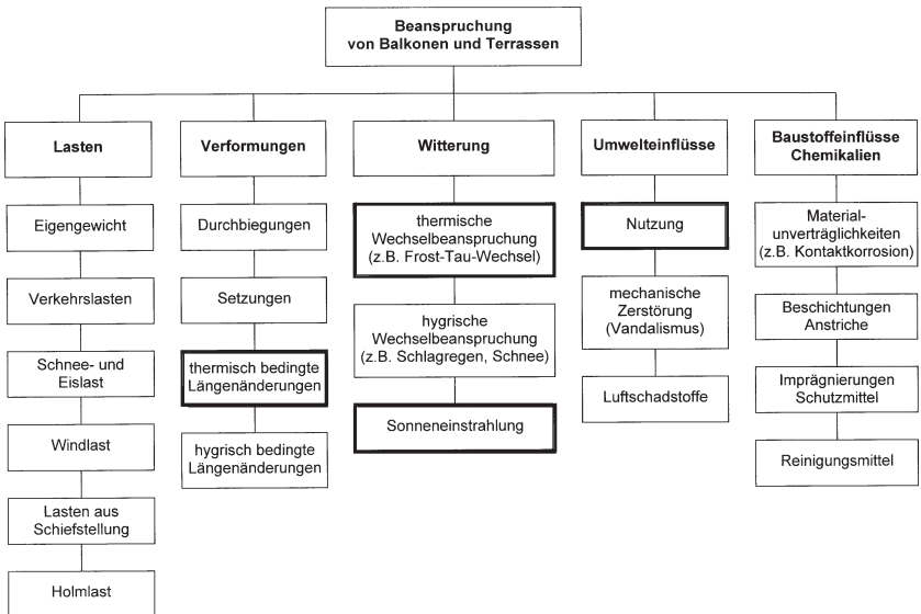
Abb. 10.1.2: Beanspruchung von Balkonen und Terrassen (fett umrahmt die für die Abdichtung besonders wichtigen Beanspruchungen)

von Balkonen und Terrassen und ihren Abdichtungen stets im Auge behalten werden. Eine systematische Übersicht über die unterschiedlichen Beanspruchungen von Balkonen und Terrassen kann der nachfolgenden Abbildung 10.1.2 entnommen werden.