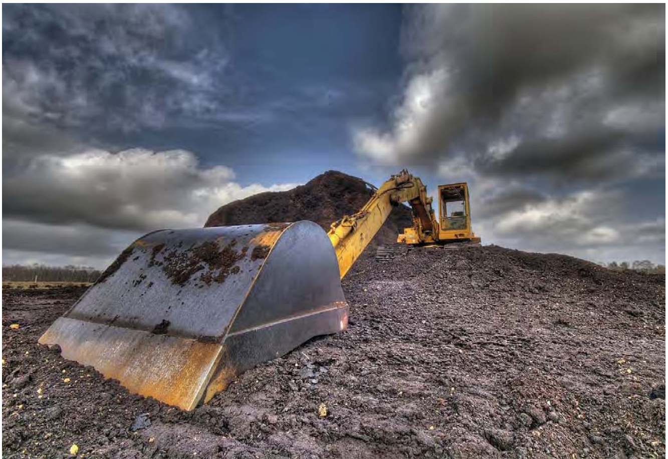
Bei Grabenarbeiten muss vieles beachtet werden