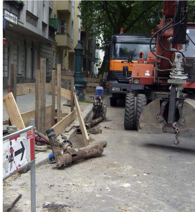
Im Notfall muss der Baggerführer mit der Hand weitergraben, um Leitungen nicht zu beschädigen

ob er schon bis zur Verlegungstiefe der Versorgungsleitungen bei seinem Erdaushub vorgedrungen ist, hat er notfalls mit der Hand weiter aufzugraben, um jegliche Beschädigung der Versorgungsleitungen auszuschließen.