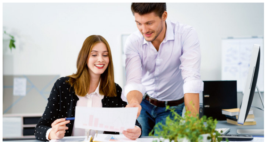
Die Unternehmen sind im Rahmen ihres Risikomanagements verpflichtet, regelmäßige (mindestens einmal jährlich) Risikoanalysen durchzuführen.

Werden Risiken identifiziert, gilt es, auf Basis der Analyse geeignete präventive Maßnahmen umzusetzen. Beispielswei-