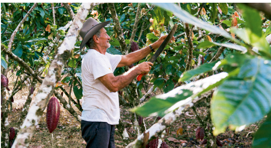
Ermitteln Sie Ihre direkten Zulieferer, die aus Sicht des LkSG risikorelevant sein könnten, und führen Sie entsprechende Risikoanalysen durch.

Hat der Kunde einen hohen Anteil am Umsatz, ist Ihr Spielraum bei Verhandlungen