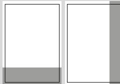
1/4 SEITE QUER ODER HOCH