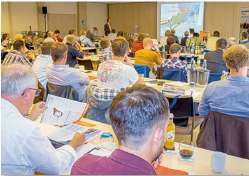
Impressionen von vergangenen Bauleiter-Fachtagungen (Archivbilder)