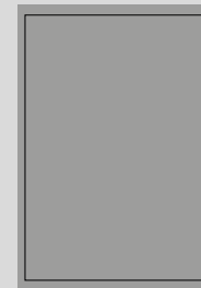
ANZEIGE U4 1/1 SEITE 210 x 297 mm