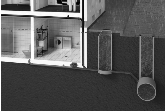
Abb. 3.5.1-2: Schutz durch eingebaute Rückstausicherung bei festgelegter Rückstauebene = Straßenoberkante.

Die Festlegung der maßgebenden Rückstauebene sollte man sich grundsätzlich vom Betreiber des öffentlichen Kanalnetzes schriftlich bestätigen lassen.