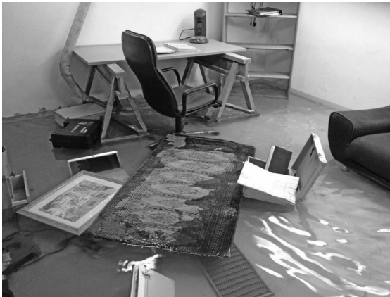
Abb. 3.5.1-1: Überflutung Kellerraum

Insbesondere bei Starkregenereignissen muss bedingt durch den Stau im öffentlichen Kanal mit Rückstau bis in die Gebäude- und Grundstücksentwässerung gerechnet werden. Sind Entwässerungsgegenstände und Ablaufstellen für Regenwasser von Flächen, die unterhalb der Rückstauenebene liegen, ohne die erforderlichen Sicherheitseinrichtungen angeschlossen, sind Schäden aus Rückstauereignissen unvermeidbar. Ziel der normativen Festlegungen zum Rückstauschutz ist die Vermeidung von Überflutungen im Gebäude und auf dem Grundstück.