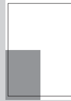
1/4 SEITE ECKFELD